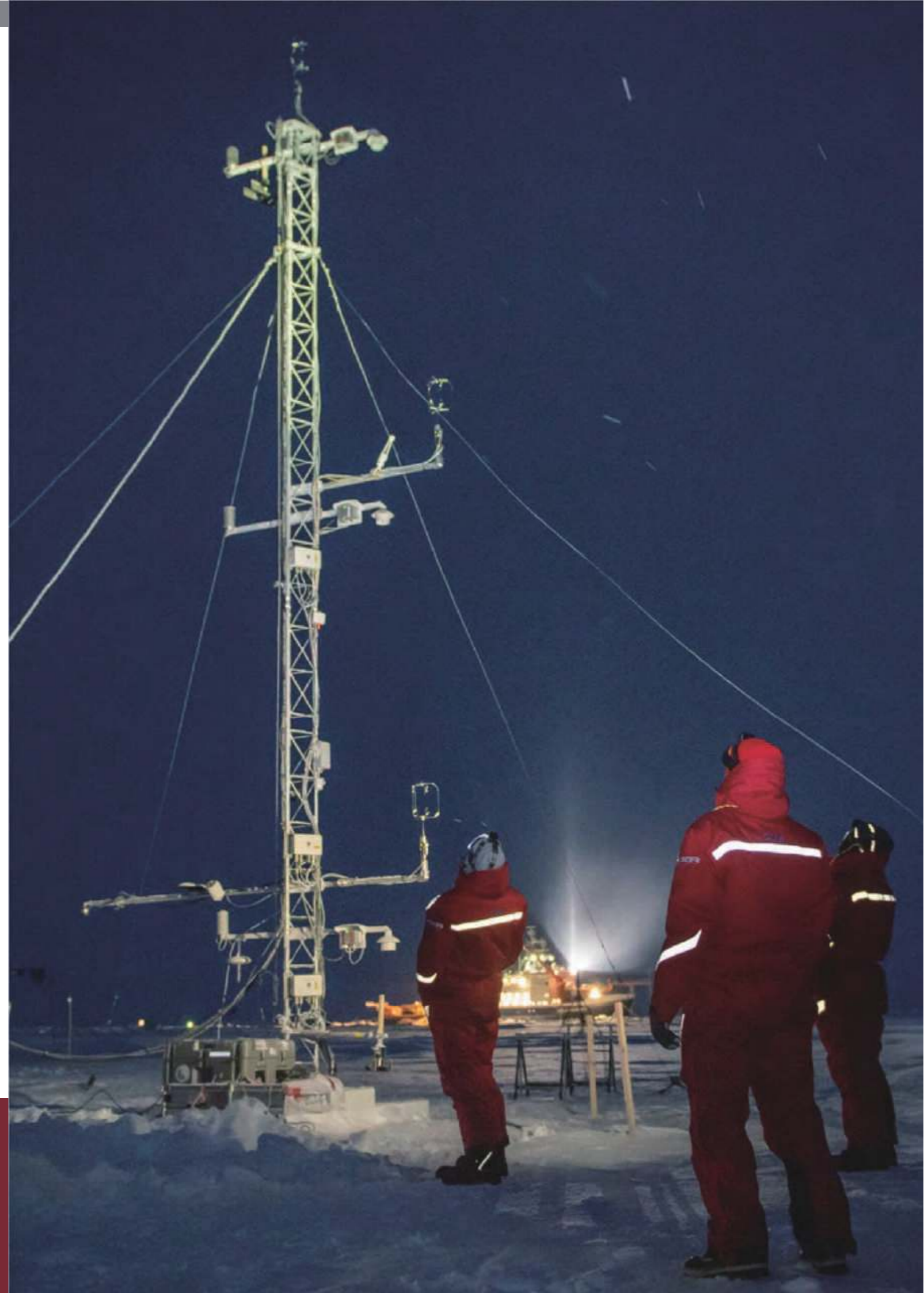
많은 계획과 준비 후, 멧 시티(Met City)에 11미터 높이의 기상 타워를 세웠다. MOSAiC 참여연구자들은 이 타워를 통해 다양한 대기 및 지표 측정과 샘플수집을 실시할 것이다.