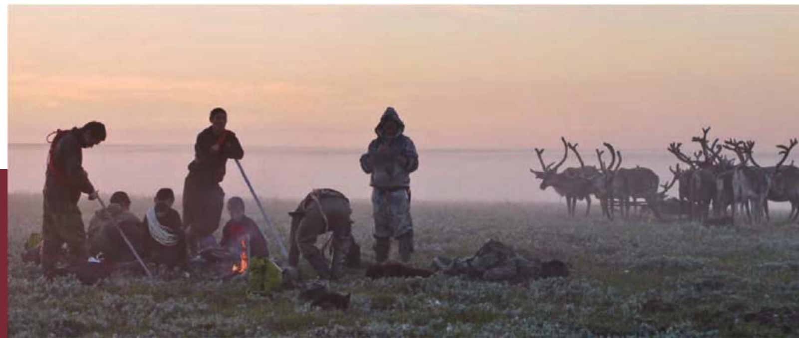
러시아 북극지역의 순록 목동들이 모닥불 주위에 모여 있다.